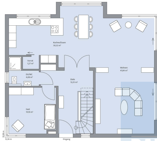
Haus Cronenberg Grundriss