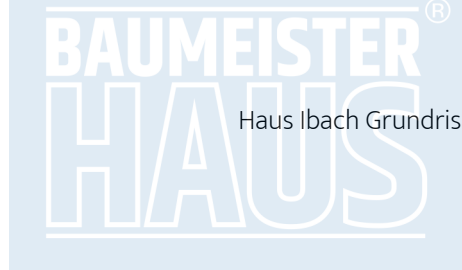
Haus Ibach Grundriss DG